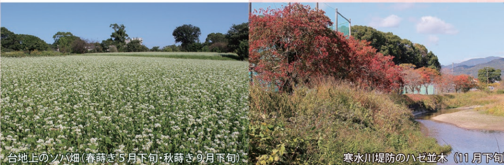
台地上のソバ畑(春時き5月下旬・秋時き9月下旬) 寒水川堤防のハゼ並木(11月下旬)

三養基新四国八十八箇所霊場 大正時代後半に四国八十八箇所巡り（お遍路）の全国的なブームが起こり、コンパクトにまとめた八十八箇所（写し霊場）が各地に設けられました。みやき町（旧3村）でも三養基新四国八十八箇所が旧中原村の有志によって設けられ、お彼岸（春分、秋分の日）を中心にお遍路が行われました。また、巡礼者をもてなす文化もありました。町内全域に点在する観音堂など（一部は上峰町や鳥栖市域にまたがる）を中心に札所が設置されていますが、一部個人住宅内のお堂などを含むので注意が必要です。 43 番札所 地蔵町地蔵尊 52 番札所 板部十三仏観音堂